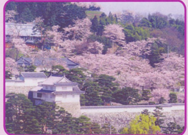
霞ヶ城公園 (桜の名所百選)

二本松藩主丹羽氏の菩提寺に咲く見事な枝垂れ桜。丹羽家累代の墓と二本松少年隊の供養塔を静かに見守っている。