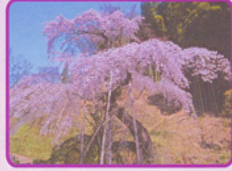
鏡石寺のシダレザクラ

推定樹齢約350年二枝に分かれ斜めに伸び、奇形を呈しながら小枝が滝のように垂れている。