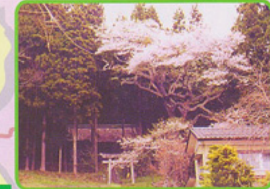
香野姫神社の夫婦ザクラ

太田字祭田地内にある推定樹齢350年のエドヒガン。近くで見ると迫力がある。©なし