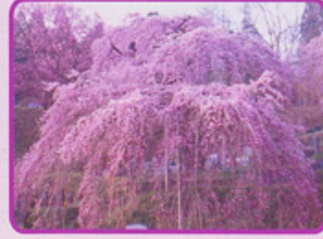
本久寺のシダレザクラ

寛永20年(1643)藩主丹羽氏が入府した年に植樹されたと伝えられる。枝振りが見事である。