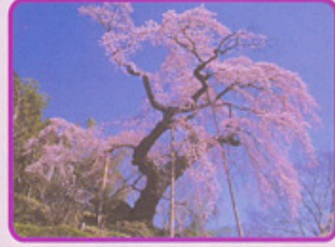
蓮華寺のシダレザクラ

八幡太郎義家と安倍貞任・宗任との合戦場と伝わる地に立つ。「三春の滝桜」の孫桜ともいわれ、滝が落ちるような見事な花を咲かせる。推定樹齢150年