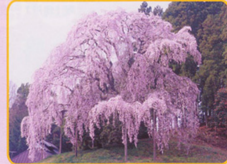
合戦場のしだれ桜

ソメイヨシノを中心に1700本もの桜が咲き語り全山隈に包まれる。桜祭期間中(4月10日から5月5日)は夜桜も楽しめる。本丸に向う公園北側上部は遅くまで桜が残っている。